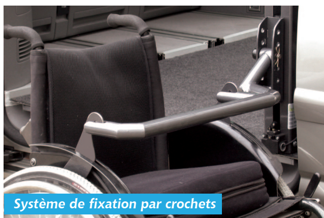
Système de fixation par crochets

Le Slv 499 est un bras élévateur qui permet de charger une personne assise sur son propre fauteuil, dans un monospace. Par ses dimensions réduites et sa conception, il permet d'accéder au véhicule même si celui-ci est garé près d'autres voitures. Ce système, qui soulève une charge maximale de 220 kg, est esthétiquement très apprécié car il ne nécessite pas de plateforme, et laisse complètement libre l'accès aux sièges de la banquette arrière. Il représente une solution idéale pour qui souhaite aller au poste de conduite directement en fauteuil, ou même pour être tout simplement transporté. Il est normalement fourni avec des sangles que l'on fixe aux barres du bras, mais il est aussi possible d'avoir la solution de fixation par crochets (à installer sur le châssis du fauteuil). Le bras peut être replié à la verticale, ou facilement démonté pour avoir plus d'espace. Ce produit est prévu pour fauteuils manuels et électriques.