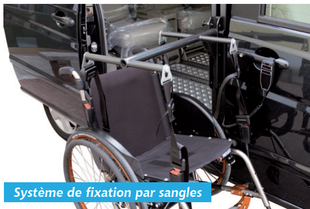
Système de fixation par sangles